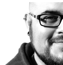
Natale Palazzo Druckvorstufe

dirk.assfalg@typico.com + 43 (0) 55 74 45 221-19